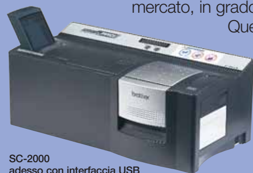
SC-2000 adesso con interfaccia USB

Questo semplice e rivoluzionario sistema è costituito da componenti di elevata qualità che assicurano affidabilità e longevità del prodotto. E c'è di più: Stampcreator Pro Brother ha dimensioni così compatte da essere portatile ed occupare uno spazio minimo in qualunque ufficio o punto vendita.